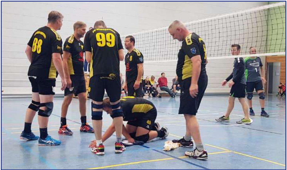
Ein schweißtreibender Saisonauftakt für die Herren des SV Altengamme.

Wir sehen uns ... In der Hölle von Gammel