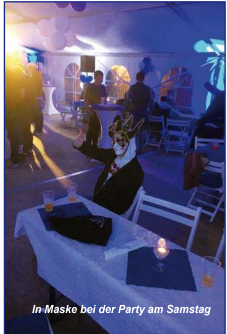
In Maske bei der Party am Samstag